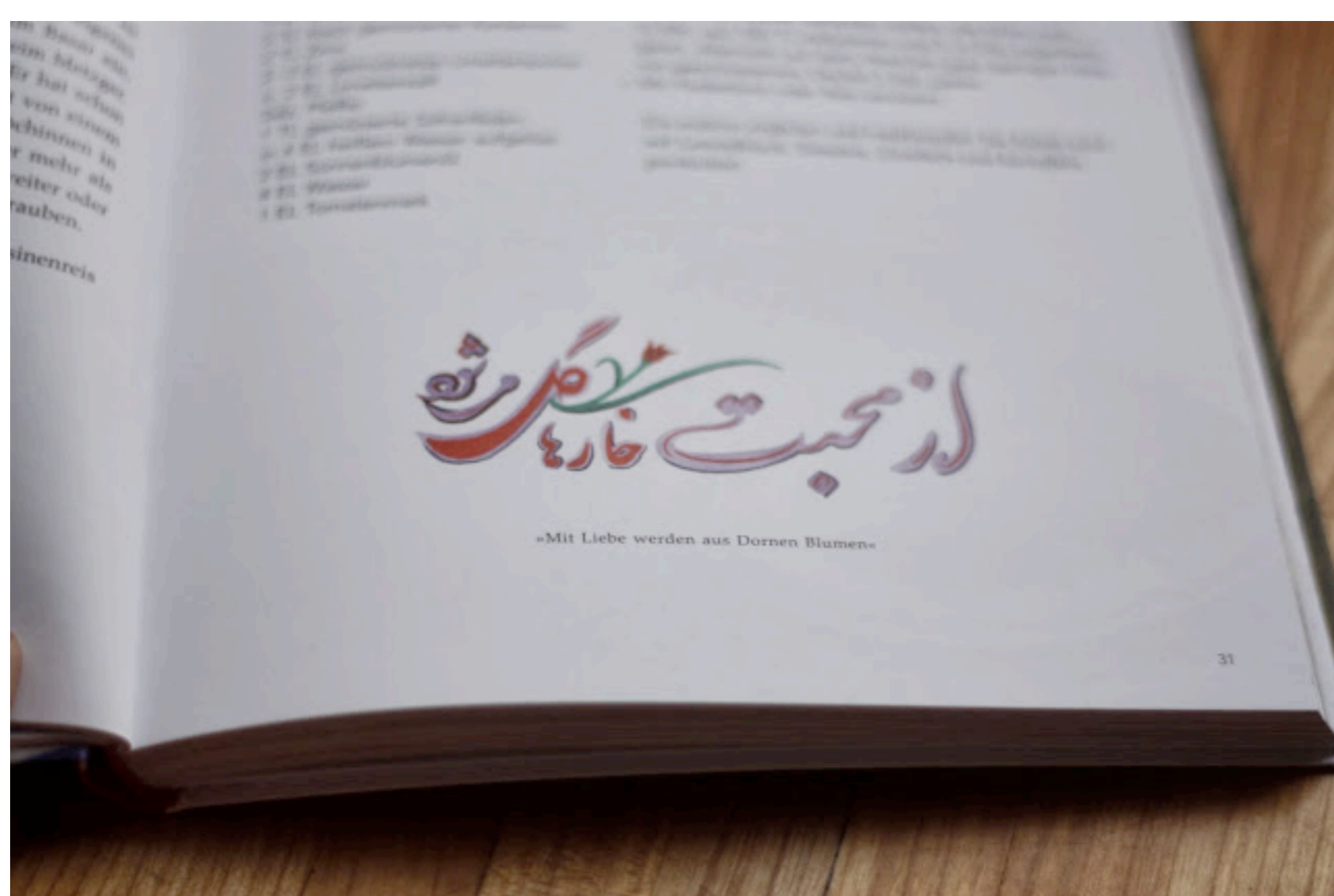
Sogar Poesie findet man in diesem außergewöhnlichen Kochbuch.

Mehr zum Buch könnt ihr auf der Internetseite des Verlags nachlesen.