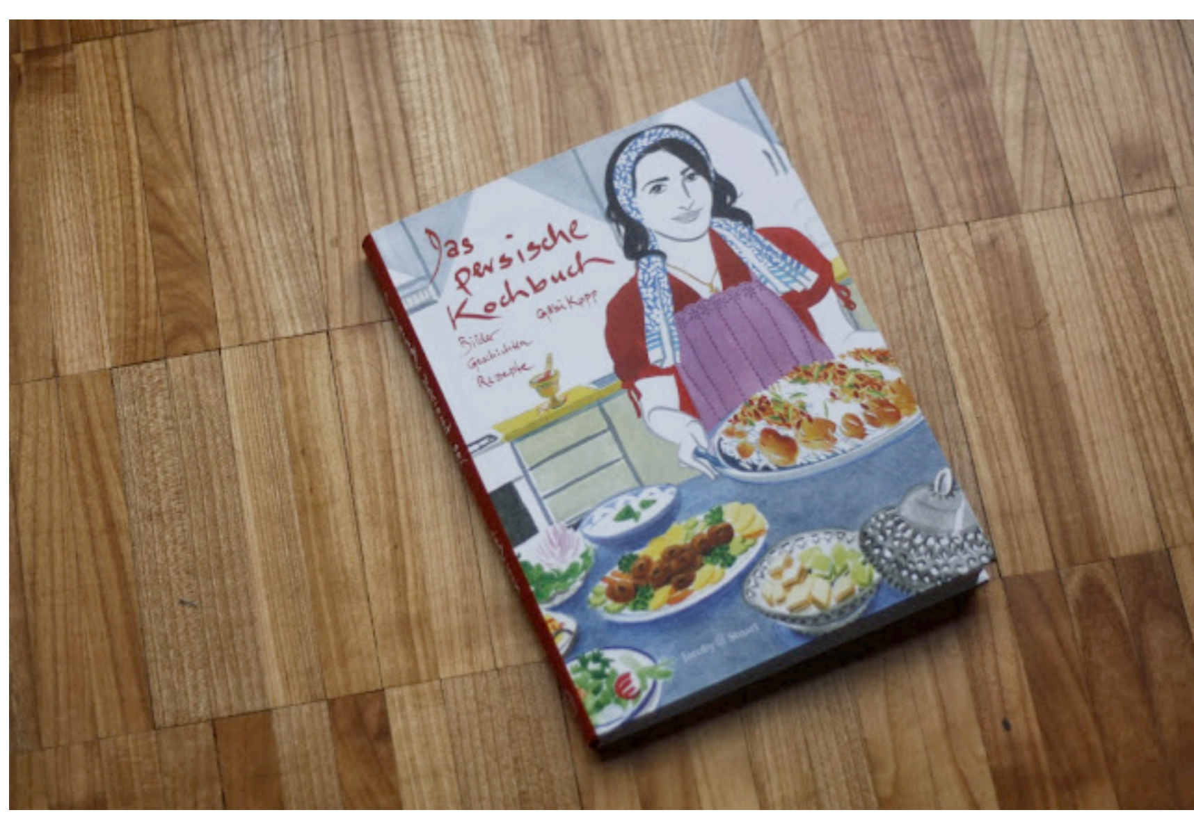
Schon das Titelbild ist ein Augenschmaus.

Keine Fotos oder kategorisiert ein Rezept pro Seite, SONDERN wunderschöne Illustrationen und die Rezepte sind geschickt zwischen farbenfrohen Geschichten eingeflochten, so macht schon das Lesen und Ansehen des Buches einfach nur Spaß.