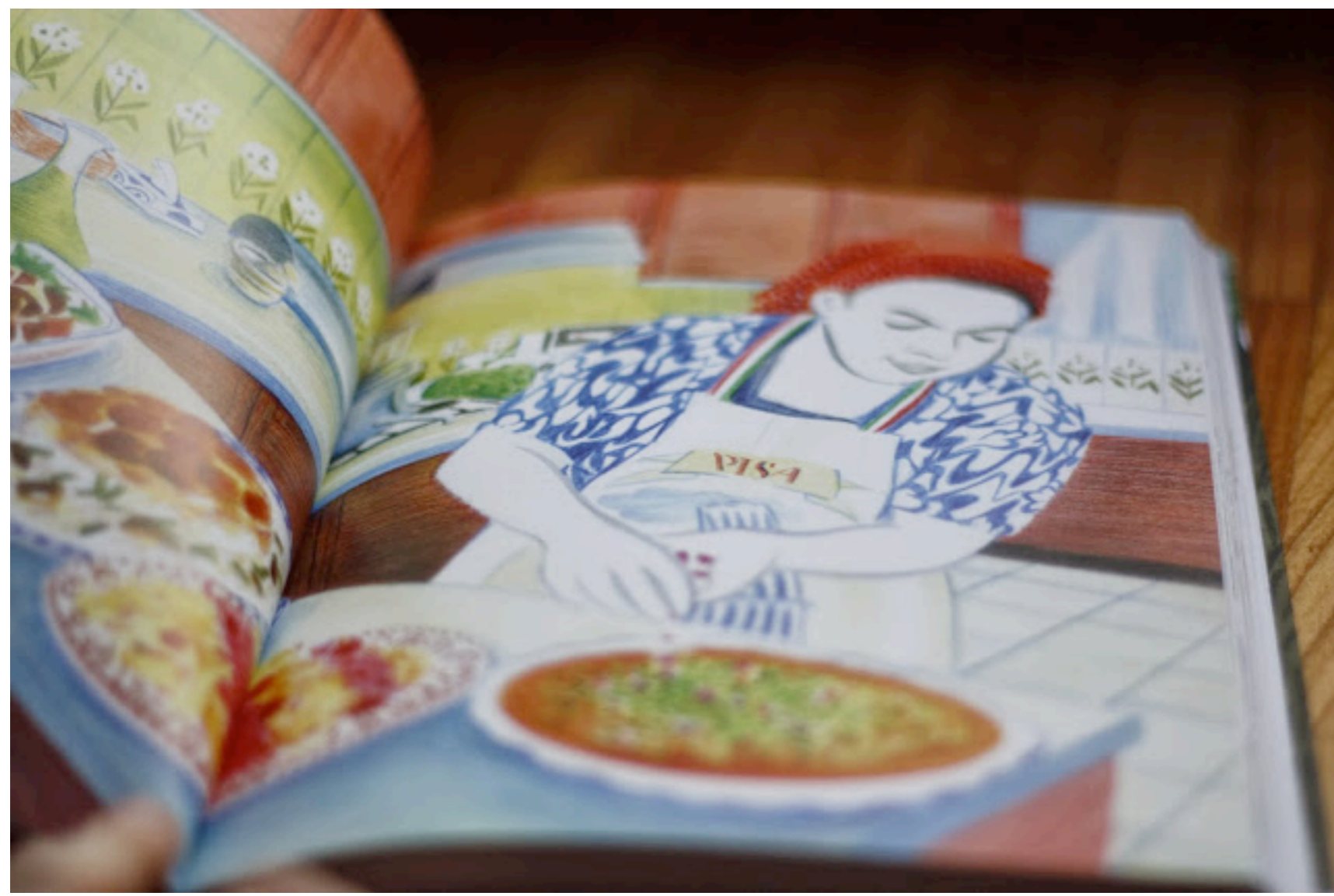
Besser als jedes Foto: Die Illustrationen der Autorin sind einfach schön.

Im Kochbuch habe ich entdeckt, dass die persische Küche nochmal anders ist, irgendwie noch exotischer und bunter, stark geprägt von Traditionen und teilweise jahrhundertlang unveränderten Rezepten.