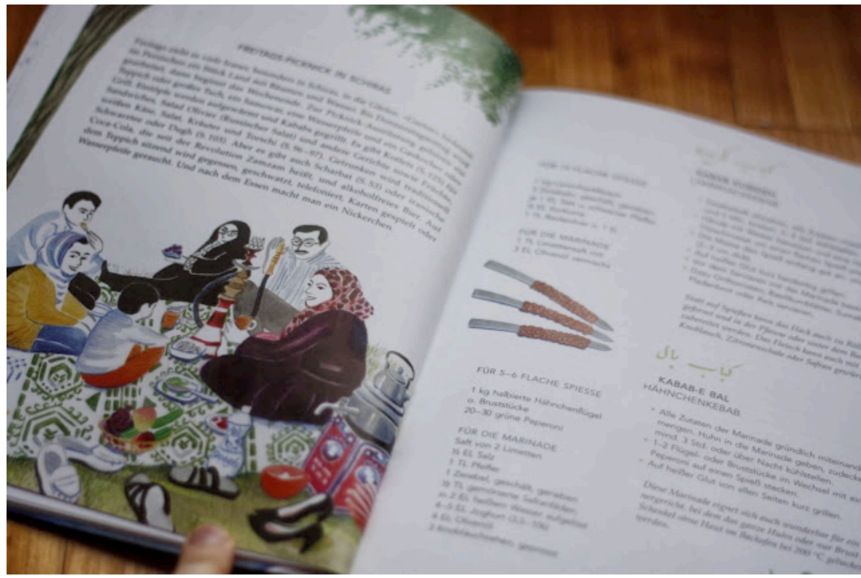
Detaillierter Einblick ins persische Familienleben bekommt man durch kurze Geschichten zwischen den Rezepten.

Die Autorin Gabi Kopp ist Schweizerin, Illustratorin und Köchin - Eine tolle Mischung die es ihr zusätzlich zu ihrer Reiseerfahrung durch Persien ermöglicht hat ein farbenfrohes Buch zu schaffen, das mal ganz anders ist als die üblichen Kochbücher. "Das persische Kochbuch" ist eine Mischung aus Urlaubsbericht, Geschichtensammlung und Rezepten aus dem heutigen Iran.